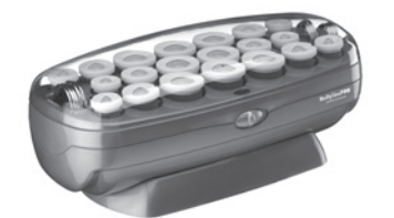
BABNTCHV21 - Set de 20 rulos 8 rulos grandes de 1¼ in (32 mm) 6 rulos medianos de 1 in (25 mm) 6 rulos pequeños de ¾ in (19 mm)