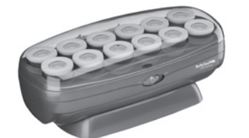
BABNTCHV15 - Set de 12 rulos 12 rulos "jumbo" de 1½ in (38 mm)