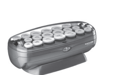
BABNTCHV21 - 20 Rollers 8 Large (1-1/4"), 6 Medium (1"), 6 Small (3/4")