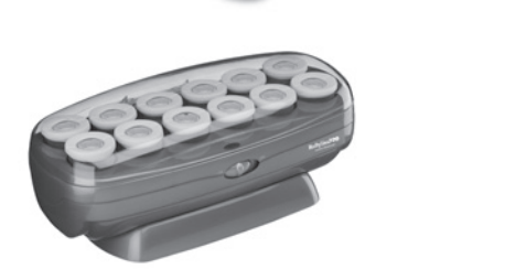
BABNTCHV15 - 12 Rollers 12 Jumbo (1-1/2")